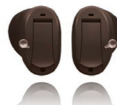
Als Im-Ohr-Variante lassen sich Microsysteme auch im Ohr verstecken.

Microsystem hinter dem Ohr – Sie sehen, dass Sie fast nichts sehen!